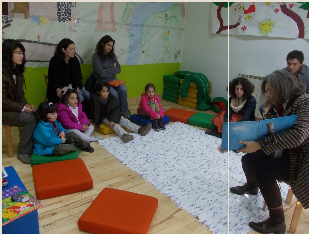
Sala da Hora-do-Conto “O Homem de Água”